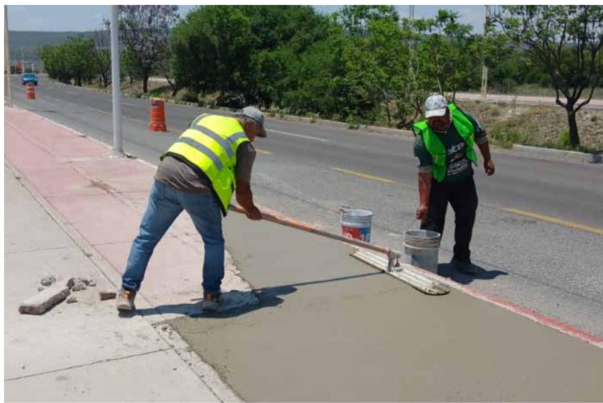
Trabajos en adecuaciones de banqueta