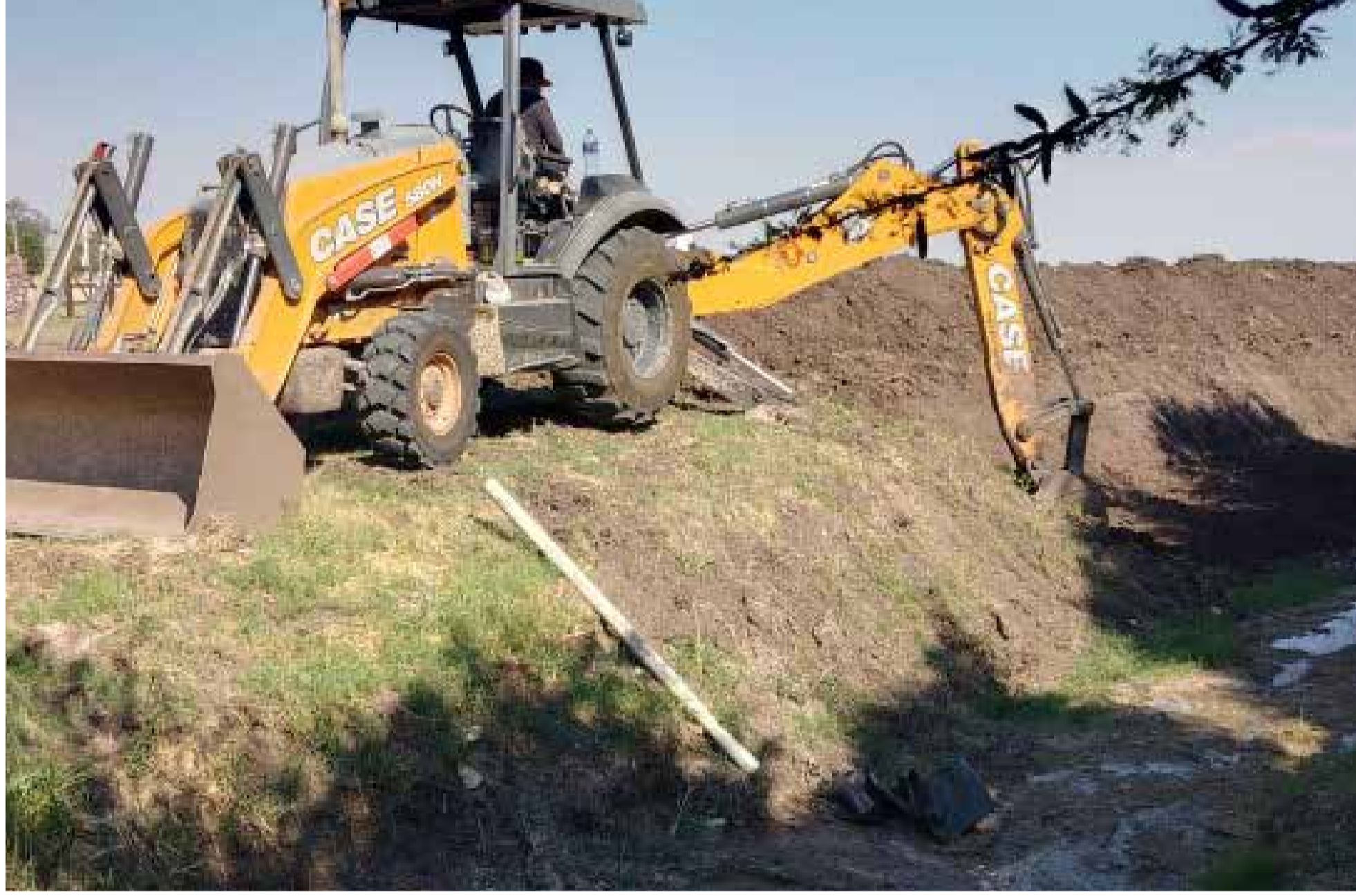
Corte de canal y trabajos varios