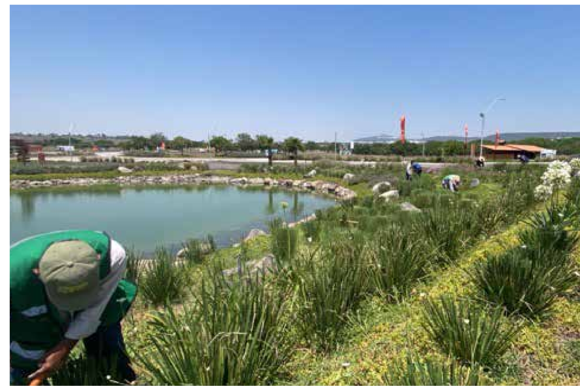
Mantenimiento general de áreas verdes

Te invitamos a conocer los avances de obra en tiempo real. Acércate al desarrollo y siente cómo crece tu futuro.