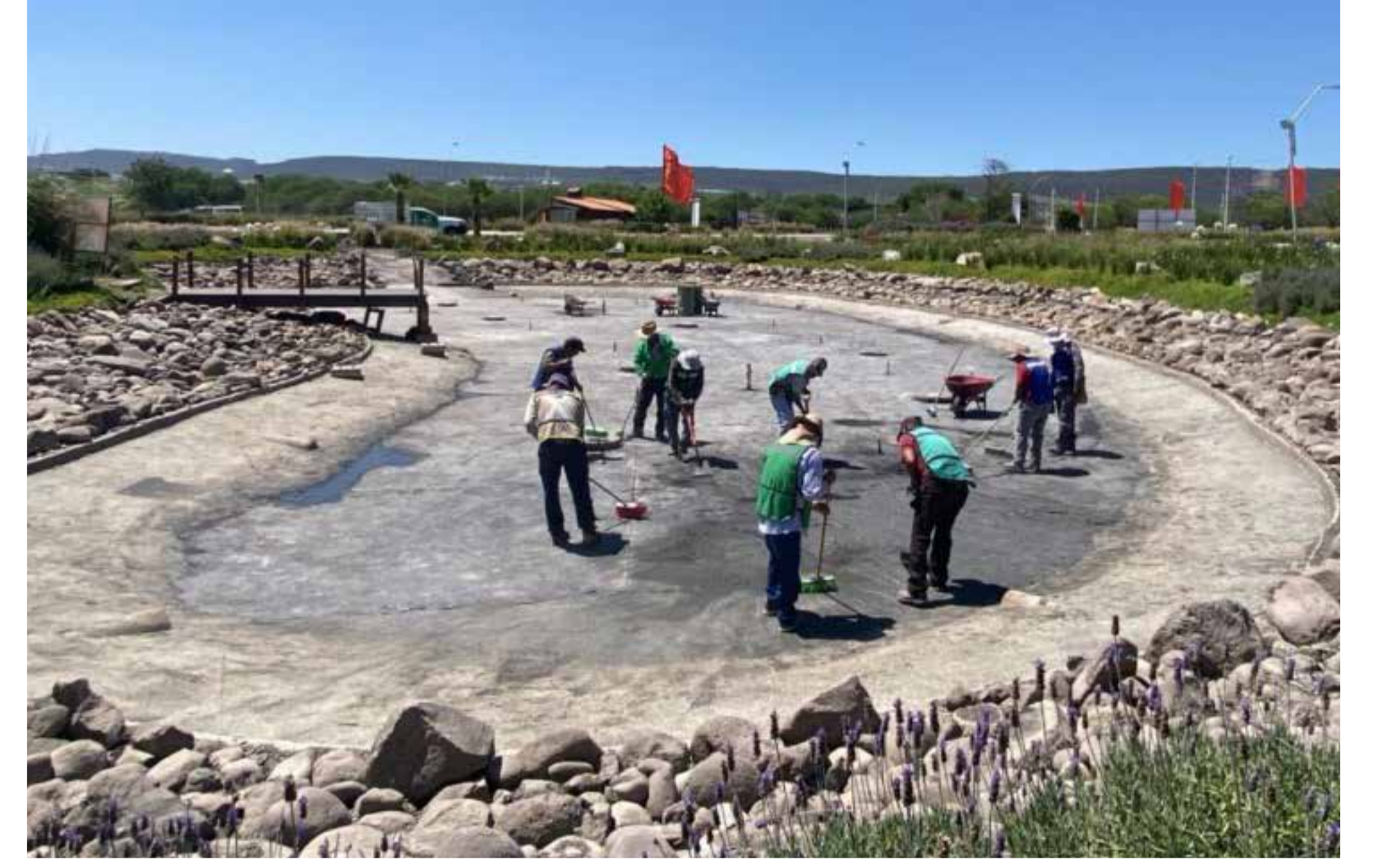
Trabajos de desasolve de lodos y limpieza general de lago