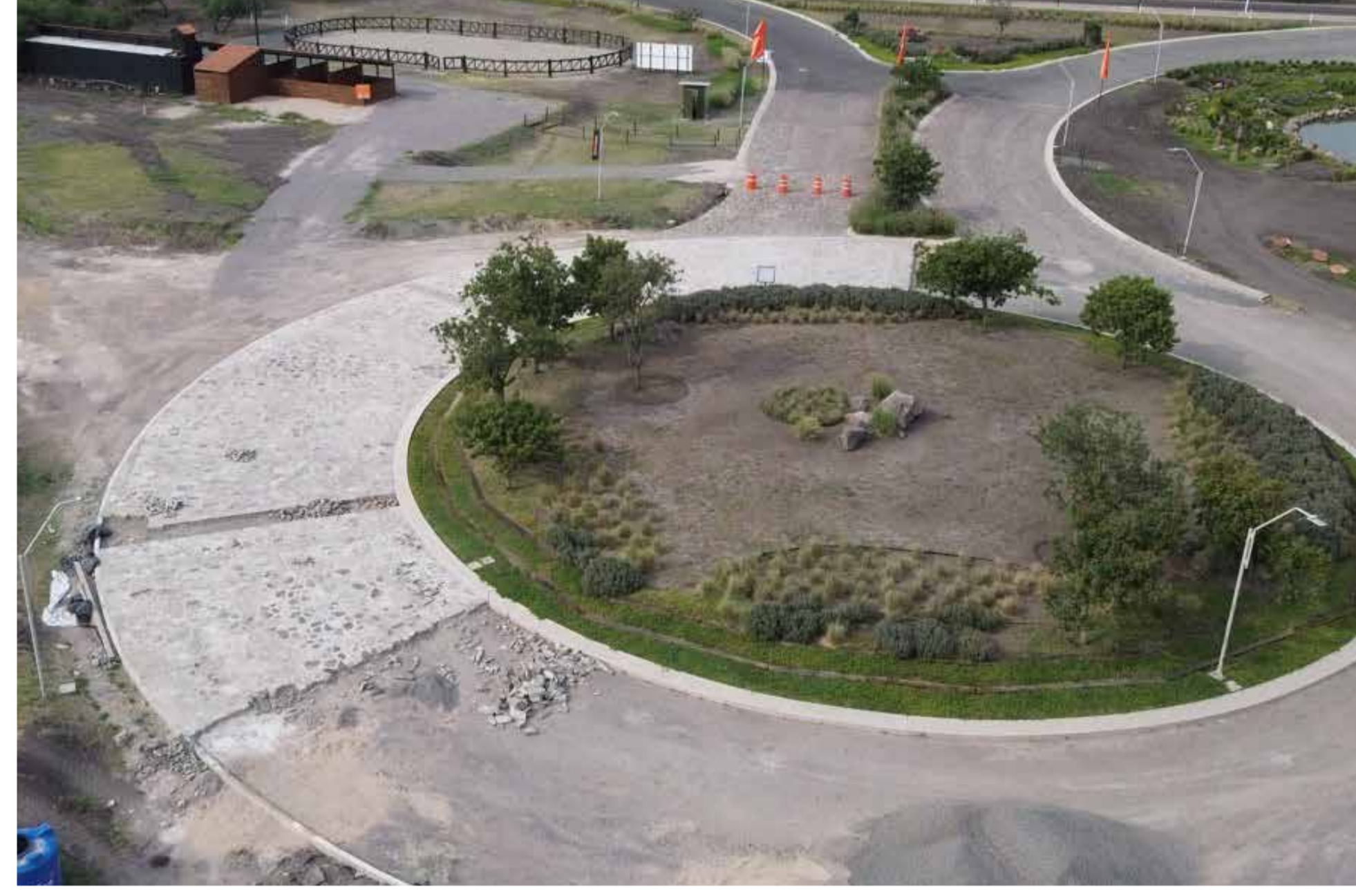
Avance del 45% tapete en laja sección glorieta